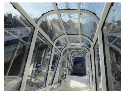
Vitrage des escaliers