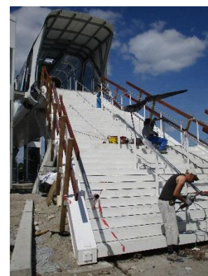
Pose des garde-corps